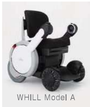
WHILL Model A